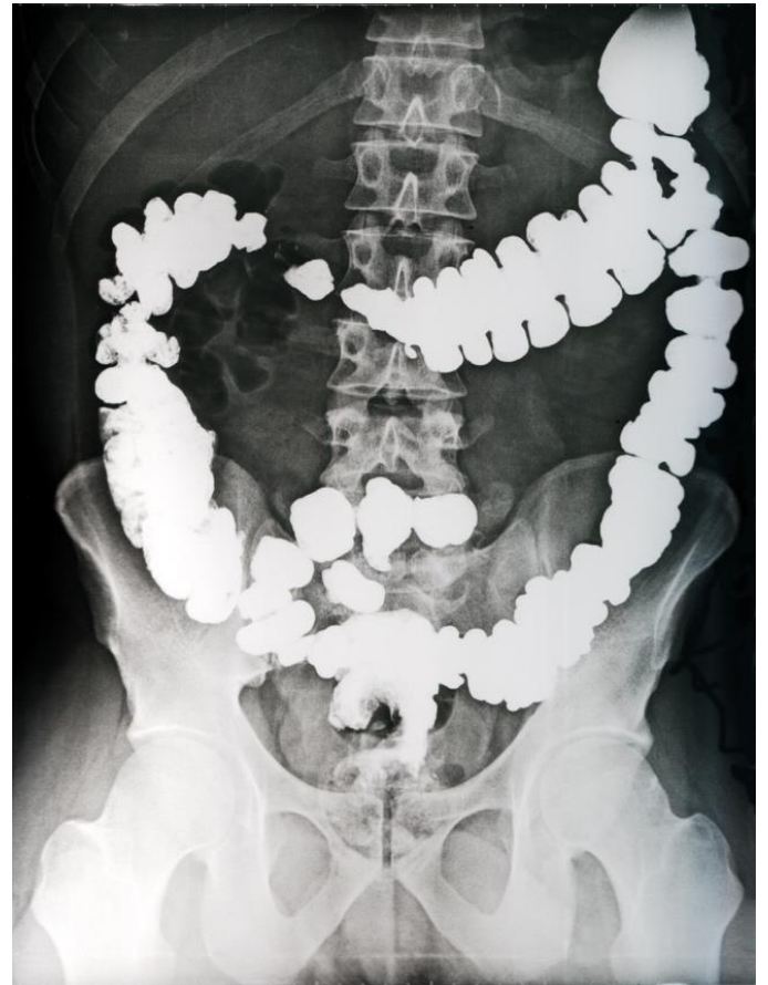
باستخدام مادة التباين