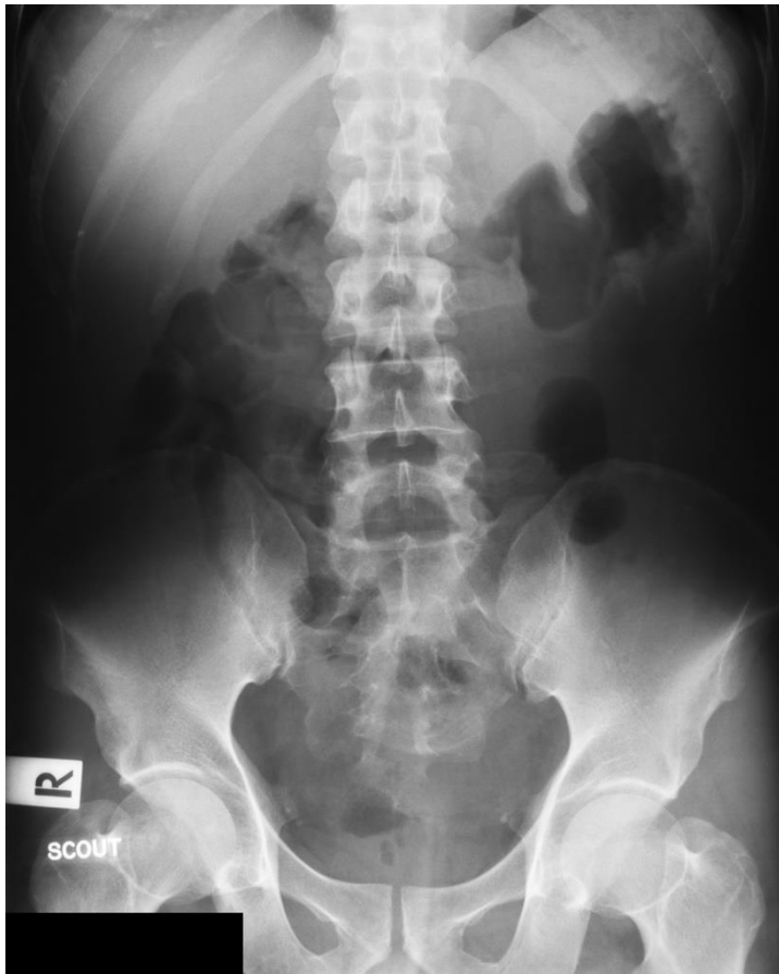
بدون مادة التباين